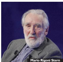
Mario Rigoni Stern